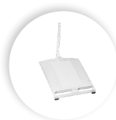
R-GO MORELIA DOCUMENTHOUDER