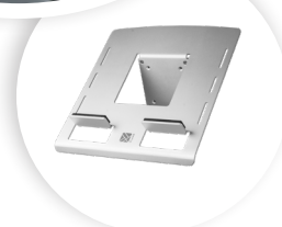
R-GO MORELIA LAPTOPHOUDER